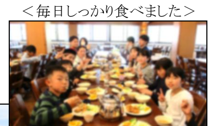
<毎日しっかり食べました>

テレビゲーム等がない5日間 でしたが、子どもたちは仲間と 「最高の思い出」を作りました。