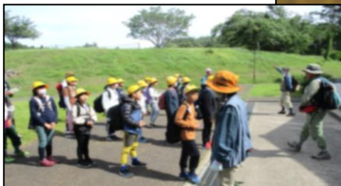
<4日目…ネイチャーバイキング>