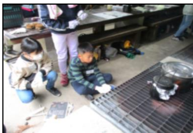
<3日目…飯ごう水さん>