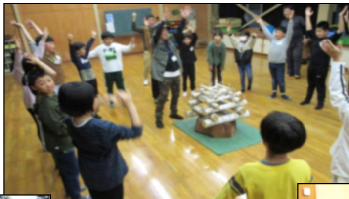
<4日目…キャンドルサービス>