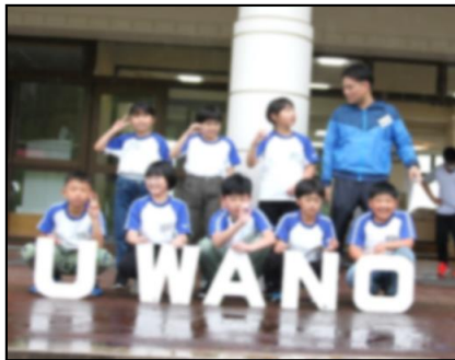
<1日目…入所> <ちくわづくり>

兔和野高原野外教育センターでの活動を中心に5月29日～6月2日まで実施しました。4泊5日、いろいろなことがありました。初日、雨での開校式。2日目は晴天のもとでの瀬川山登山。3日目もよい天気の中での飯盒炊さん、その後オリエンテーリング。4日目、好天でのネイチャーバイキング、しかし、またまた雨のためキャンプファイヤーのかわりのキャンドルサービス…。天候が幾度となく変化する自然の中で、グループで活動し、自分のよさや友達のをよさを発見しながら、絆を深めました。自然とふれあう中で多くのことを学び、5日間がんばりぬきました。